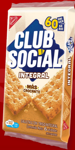
CLUB SOCIAL INTEGRAL