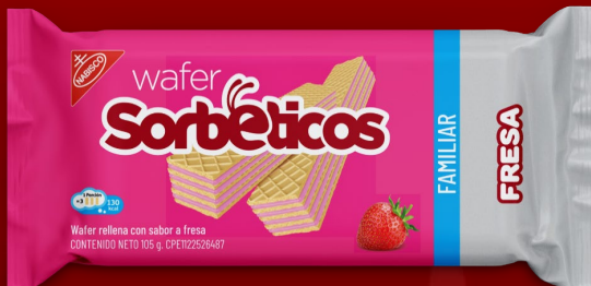
GALLETA SORBETICO FRESA 105 GR