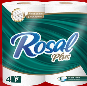
ROSAL 4 ROLLOS 215 H