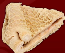
PANZA DE RES