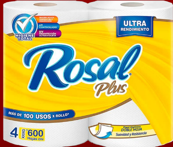
ROSAL 4 ROLLOS 600 H