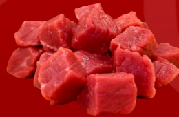
CARNE PARA PEPITO