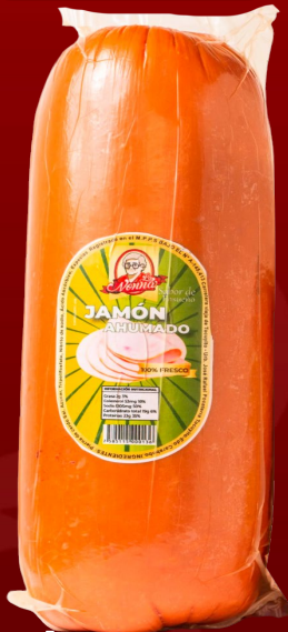
JAMÓN DE ESPALDA