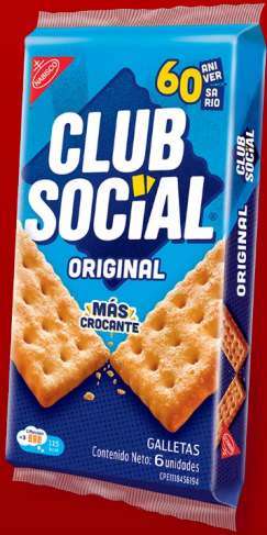
CLUB SOCIAL ORIGINAL