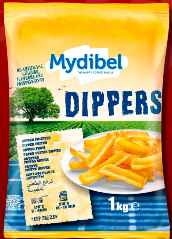
PAPAS CONGELADAS MYDIBEL 1 KG