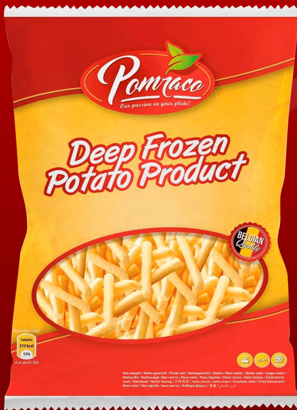
PAPAS CONGELADAS POMRACO 1 KG