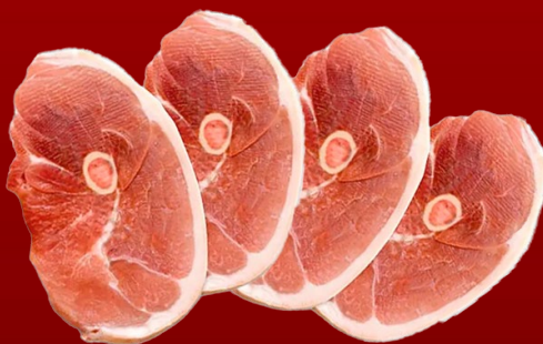
CHULETA DE PERNIL