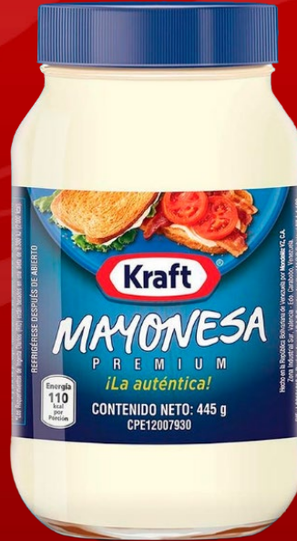
MAYONESA KRAFT 445 GR