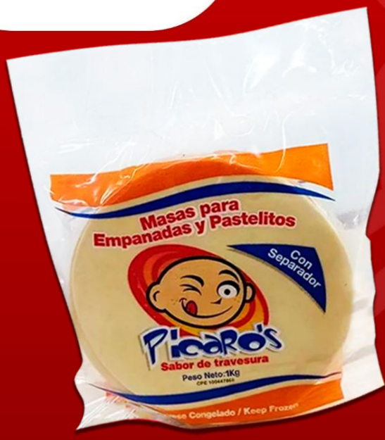
MASA PICAROS 1 KG