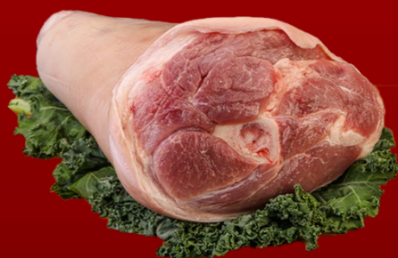
PERNIL DE CERDO