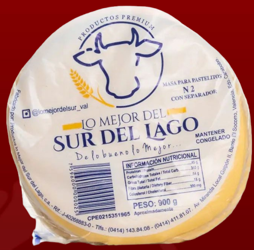
MASA SUR DEL LAGO 900 GR