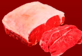
SOLOMO DE CUERITO