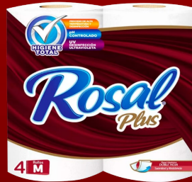
ROSAL 4 ROLLOS 300 H