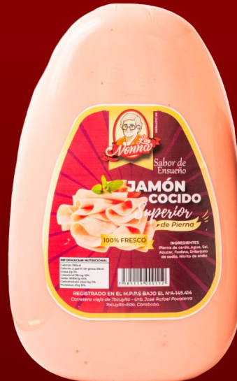
JAMÓN DE PIERNA