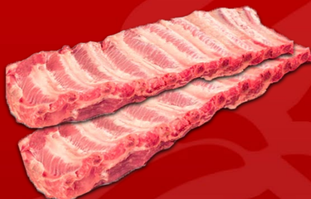
COSTILLA DE CERDO