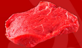
CARNE PARA MECHAR