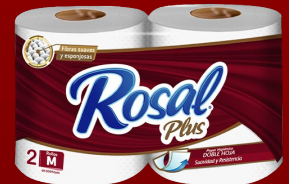
ROSAL 2 ROLLOS 300 H