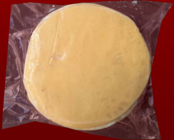
MASA DE PASTELITOS 1 KG