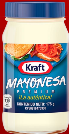
MAYONESA KRAFT 175 GR