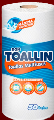
DON TOALLIN MULTIUSOS