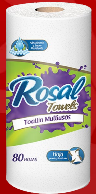
ROSAL TOWELS 80 H