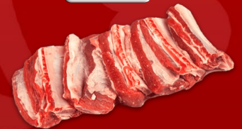
COSTILLAS DE RES