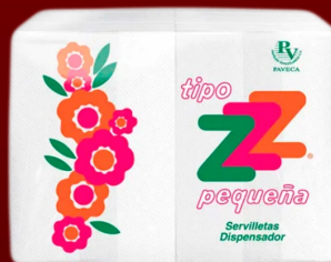
SERVILETA Z PEQUEÑA 160 H