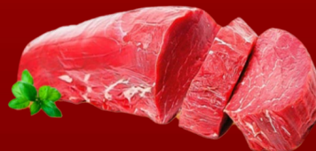
LOMITO DE RES