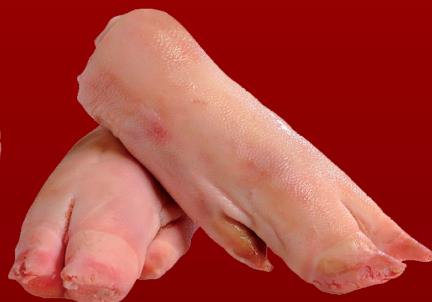
PATAS DE CERDO