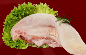
LENGUA DE RES