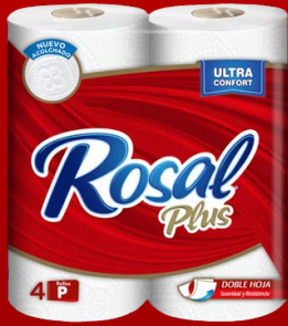
ROSAL 4 ROLLOS 180 H