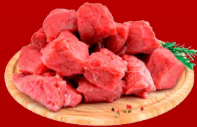
CARNE PARA GUIJAR