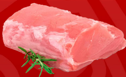
PULPA DE CERDO