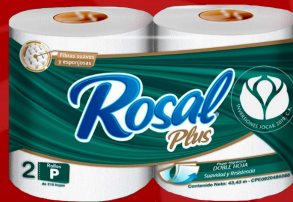
ROSAL 2 ROLLOS 215 H