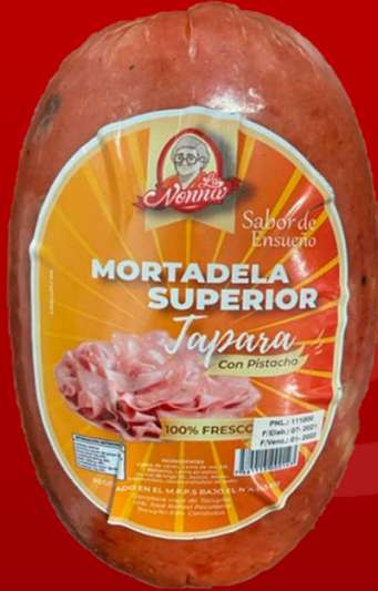
MORTADELA SUPERIOR TAPARA