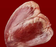
CORAZÓN DE RES