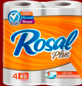
ROSAL 4 ROLLOS 400 H