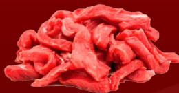
STROGONOFF DE RES