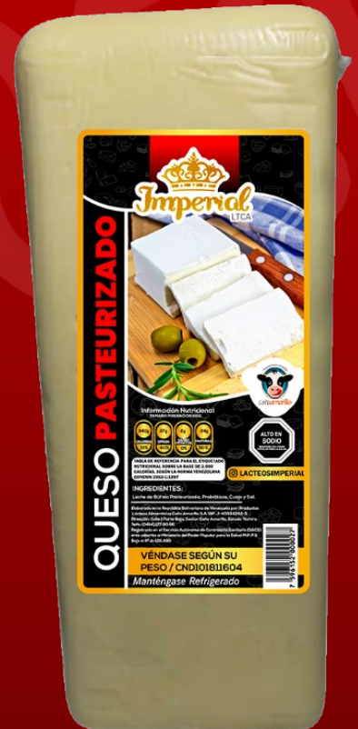
QUESO TIPO PAISA