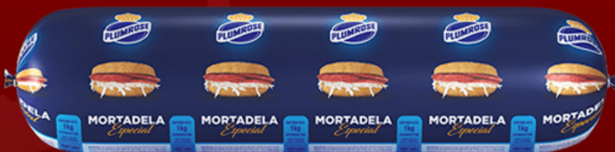
MORTADELA ESPECIAL DE CARNE PLUMROSE