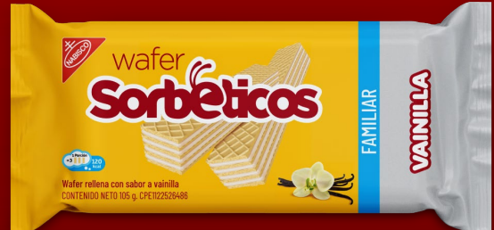
GALLETA SORBETICO VAINILLA 105 GR