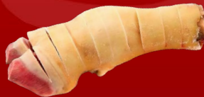
PATA DE RES