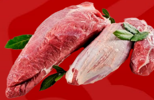
LAGARTO LA REINA