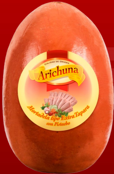
MORTADELA EXTRA TAPARA