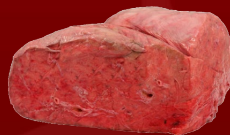
BOFE DE RES